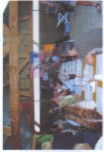
« Soirée Pizzas »