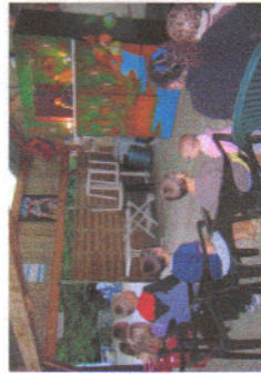
« Animation enfants »