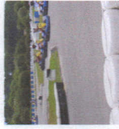
« Sortie Karting »