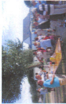
« Pot d'accueil »