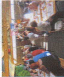
« Soirée concert »