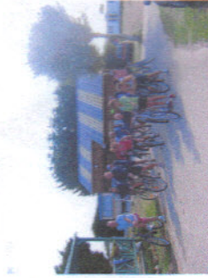
« Sortie VTT »